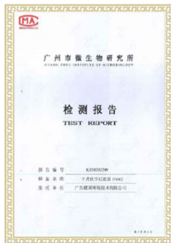
TVOC/盐酸/氨/苯过滤测试