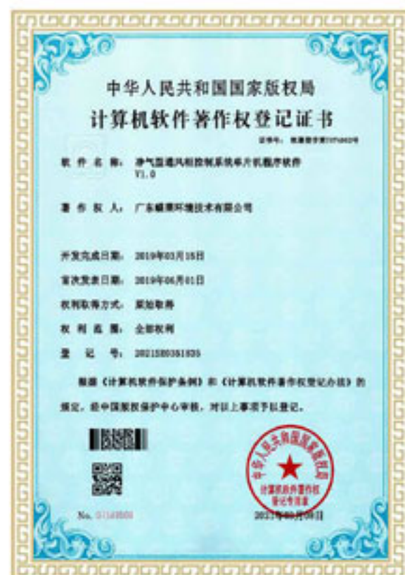
计算机软件著作权