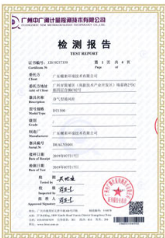
风量/面风速/噪音测试